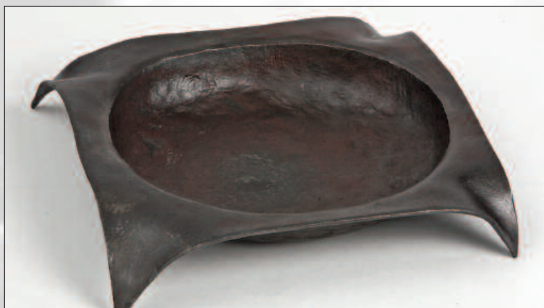
Œuvre de Tobias Herger.

Les objets d'art ont été très appréciés par l'ensemble des visiteurs. Ces pièces seront exposées à différents endroits au cours des 6 prochains mois.