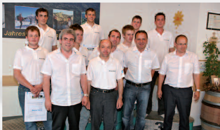
Les participants des CLIMMAR Skill avec les responsables de cet événement.