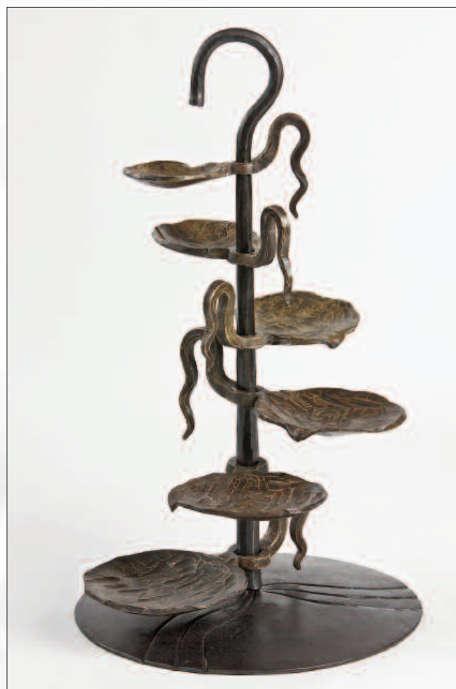
Œuvre de Urs Würsch.